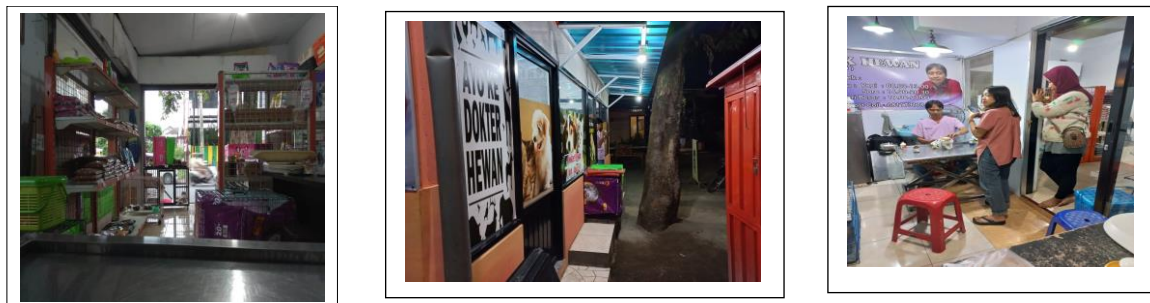
Gambar 5. Lay out/tata letak petshop plus praktek Dokter Hewan Gambar 6. Mitra UKM

Pada akhir kegiatan monitoring dan evaluasi, peserta mitra diberikan kuesioner lagi untuk mengevaluasi kegiatan dan hasil yang dicapai setelah mengikuti pelatihan dan pendampingan pengolahan produk. Hasil kuesioner disajikan dalam tabel 2 dibawah ini dibandingkan dengan hasil kuesioner sebelum pelatihan.