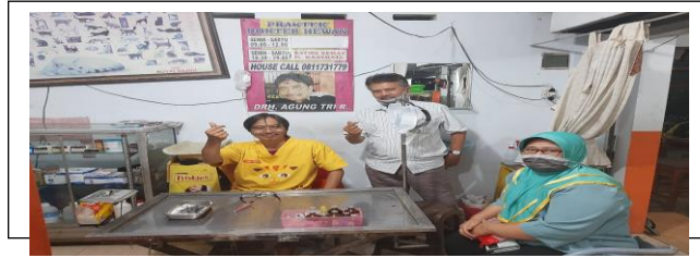
Gambar 2. Gambaran produk mitra pra survey

Tahap berikutnya, tim pengabmas dan mahasiswa datang di tempat mitra dan melaksanakan penyuluhan tentang pentingnya value added pada produk/jasa pelayanan Dokter Hewan, analisis usaha, manajemen produksi, pemasaran digital dan pengembangan usaha tanpa melalui kredit bank. Kegiatan dilanjutkan dengan diskusi terarahpraktek dokter hewan yang tepat. Acara kemudian dilanjutkan dengan proses hasil dan pengemasan hasil produk layanan Dokter Hewan. Untuk tahap ini, hasil produksi layanan masih memerlukan latihan untuk mendapatkan hasil